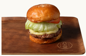
Hokkaido Wagyu Cheese Burger 北海道和牛バーガー $19.0