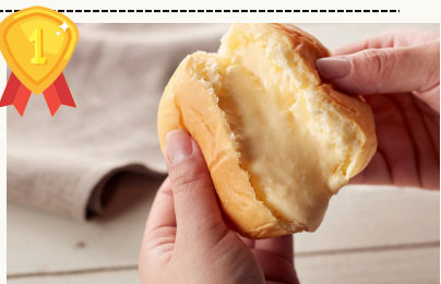
Cream Bun Custard クリームパンカスタード $3.8