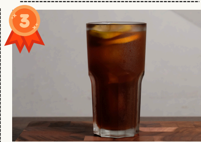
Homemade Lemon Tea 自家製レモンティー Hot/Iced $5.0/$6.0