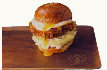
Seafood tempura fritter Burger $16.0