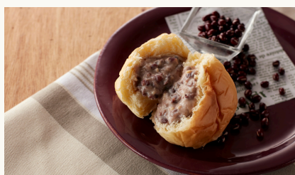
Azuki Beans Cream Bun くりーむパン 小倉あん $3.8