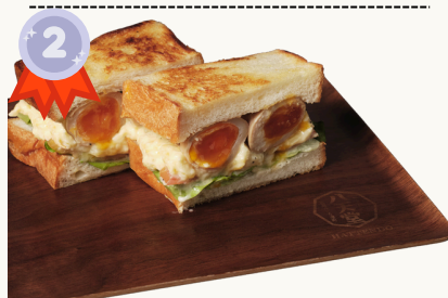
Nitamago Truffle Potato Salad 煮卵トリュフポテト $14