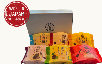
Frozen Box of 6 Furusato Cream bans $22.22