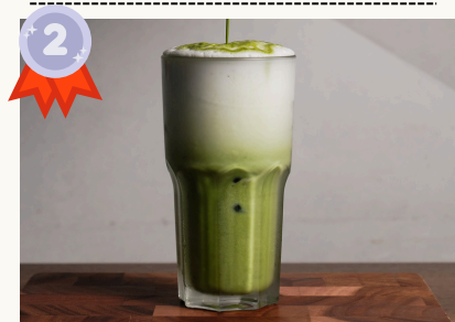
Matcha Latte 抹茶ラッテ Hot/Iced $6.0/$8.0