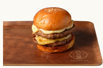
Hokkaido Wagyu Double Cheese Burger 和牛ダブルチーズバーガー $30.0