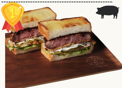
Iberico Katsu イベリコトンカツ $22