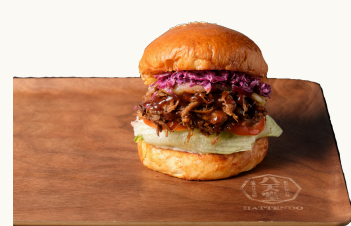
Iberico Pulled pork Burger イベリコアルドポークバーガー $18.0