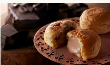
Chocolate Cream Bun くりーむパン チョコレート $3.8