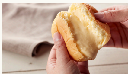
Custard Cream Bun くりーむパン カスタード $3.8