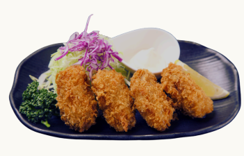
Hiroshima Fried Oyster $16.0