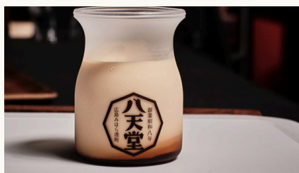
Custard Pudding とろけるプリンカスタード $4.5