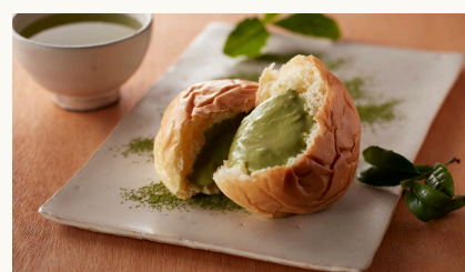
Matcha Cream Bun くりーむパン 抹茶 $3.8