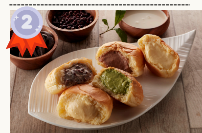
Assorted Box of 5 クリームパン5個セット $15.20