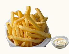
French Fries With Truffle Aioli $7.0