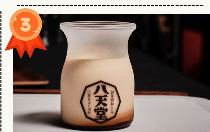
Custard Pudding とろけるプリン カスタード $4.5