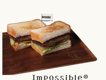
Impossible® インポッシブル® $20