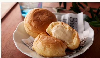
Wipped Cream Bun くりーむパン 生クリーム $3.8