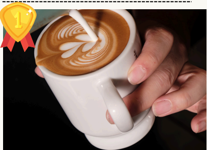
Cafe Latte カフェラッテ Hot/Iced $5.5/$6.5