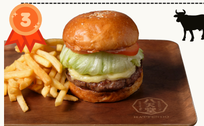
Hokkaido Wagyu Burger 北海道和牛バーガー $19