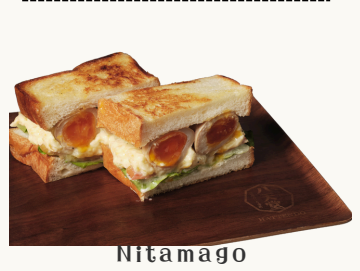
Nitamago Truffle Potato Salad 煮卵トリュフポテトサラダ $14