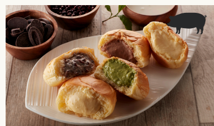
Assorted Box of 5 くりーむパン5個セット $15.20