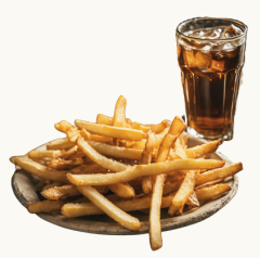
French Fries Combo フライドポテトセット $7.9 Set Drink